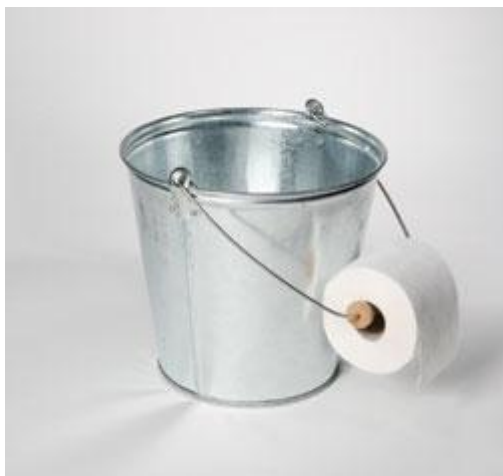
ECAL/Alejandro Bona.