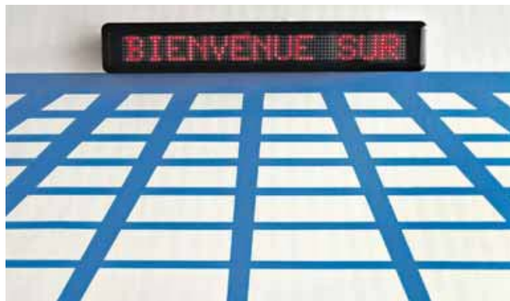
L'exposition Mille lunes se tient jusqu'au 16 juin à la Maternité.

L'homme saura-t-il trouver les parades nécessaires à sa survie et peut-être même à son épanouissement? Au sol, trois sources lumineuses incarnent les utérus artificiels prédits dans Le meilleur des mondes de l'écrivain